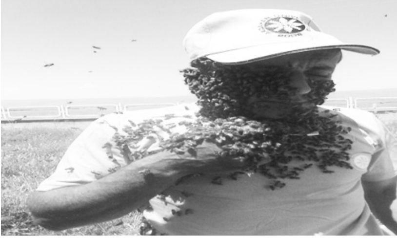
Şekil 2: Kafkas Arısının Sakinliği