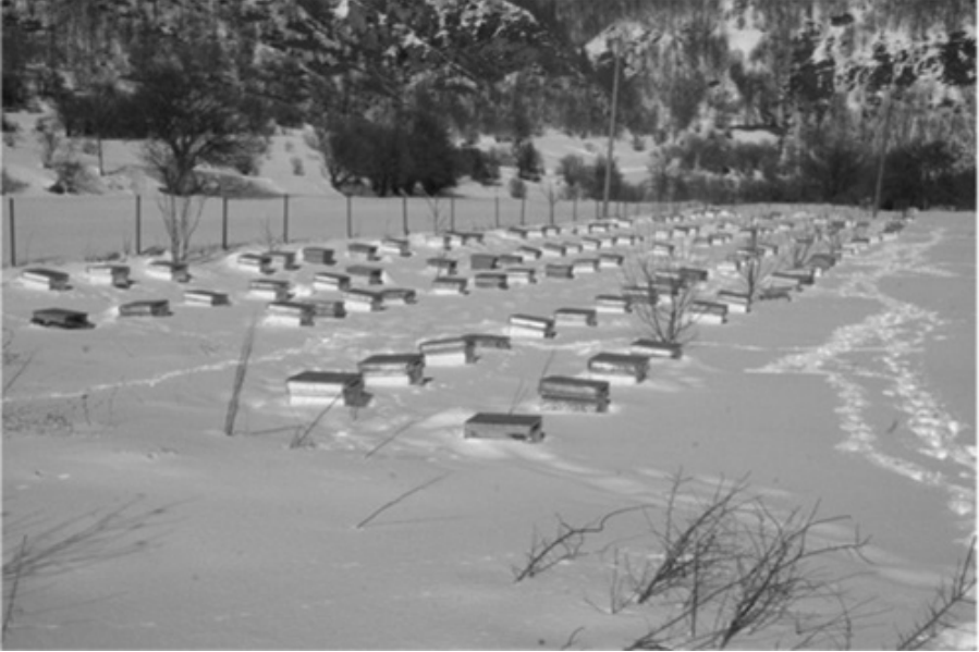
Şekil 1: Arıların Dışarıda Kışlatılması

Kafkas arısı kışa dayanıklıdır. Kışa az mevcutla girer, az gıda tüketir. Bahara zayıf çıkar fakat çabuk gelişir. Bunun için kışı uzun ve sert geçen Ardahan a iyi adepte olabilmıştır. Kışlatmadan çıkan kolonilerde kışlama yeteneği %98, yaşama gücü ise %100 e ulaşabilmektedir (Yazıcı, 2009). Ayrıca Kafkas arısı bal verimi yüksek ve uysal bir arı ırkıdır. Yağmacılık eğilimi yüksek ve nosemaya karşı hassas bir arı ırkıdır(Geçer ve Dodoloğlu,2017). Ülkemizdeki resmî kurum olarak arıcılık yapan iki kurumdan biri olan Ardahan Kafkas Arısı Üretim Eğitim Gen merkezi Ardahan da mevcuttur. Ana arı üretimi, bal üretimi tahlili ve ambalajlanması ve kovan üretimiyle ülkemiz ve Ardahan arıcılığına büyük hizmetler sunmaktadır. Yine Üniversitemizde Meslek Yüksekokulu bünyesinde arıcılık programı ve Karkas Arı ve Arıcılık Uygulama Merkezi bulunmaktadır. Ayrıca Ardahan Arıcılar Birliği de arıcılarımıza büyük hizmetler sunmaktadır.